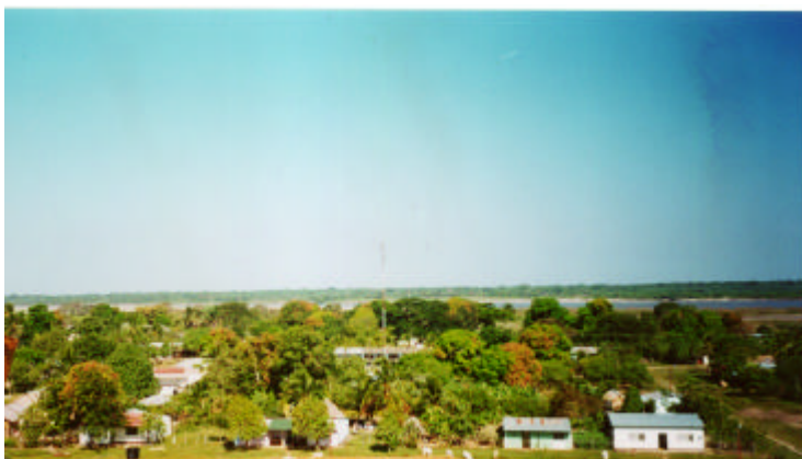
Vista parcial, cabecera municipal