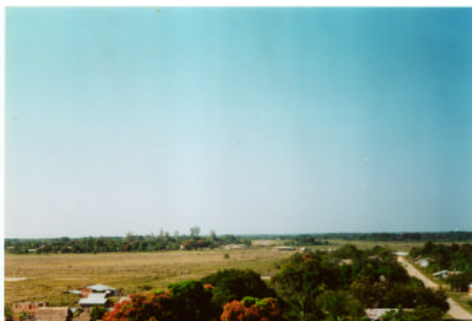
Vista parcial, cabecera municipal