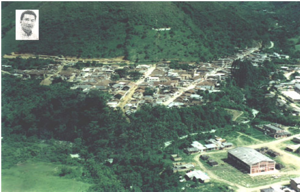
VISTA PANORÁMICA CABECERA MUNICIPAL ARGELIA—CAUCA