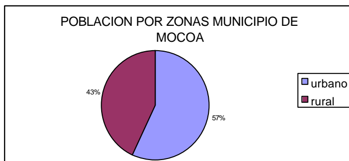
GRAFICO 1: población en la zona urbana y rural

Para el año de 1.999, según censo DANE, la población total del Municipio es de 31.719 habitantes, de los cuales 13.668 (43%), pertenecen al sector rural y 18.051 (57%) corresponden al sector urbano 2 .