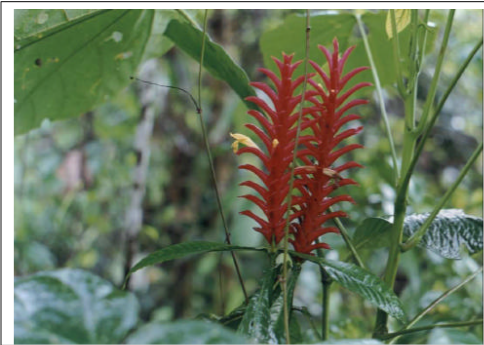
FOTOGRAFIA 1. RIQUEZA DEL MEDIO AMBIENTE